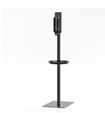
Tork Hygienestativ liten 511060