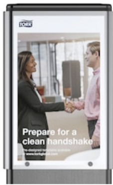
AD-A-Glance for Tork Hygiene Stand 511054